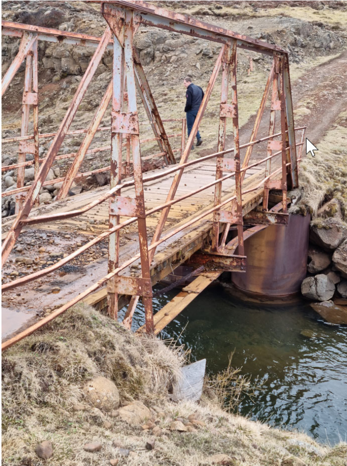
Núverandi brú sem á að skipta út.